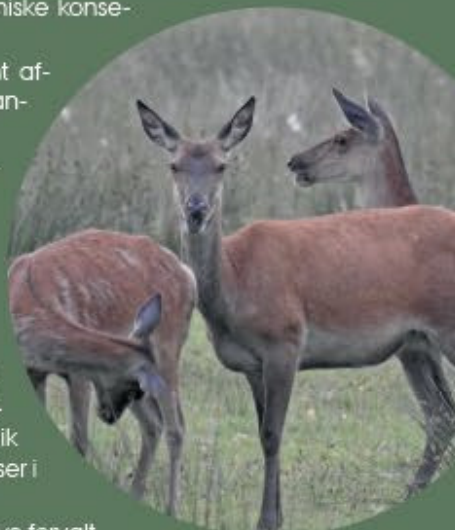
Blandt de projekter, som AU er involveret i, er forvaltning af kronvildt på og omkring Ovstrup Hede.

Centret har erfaring fra og er involveret i en række projekter og processer, herunder fx: