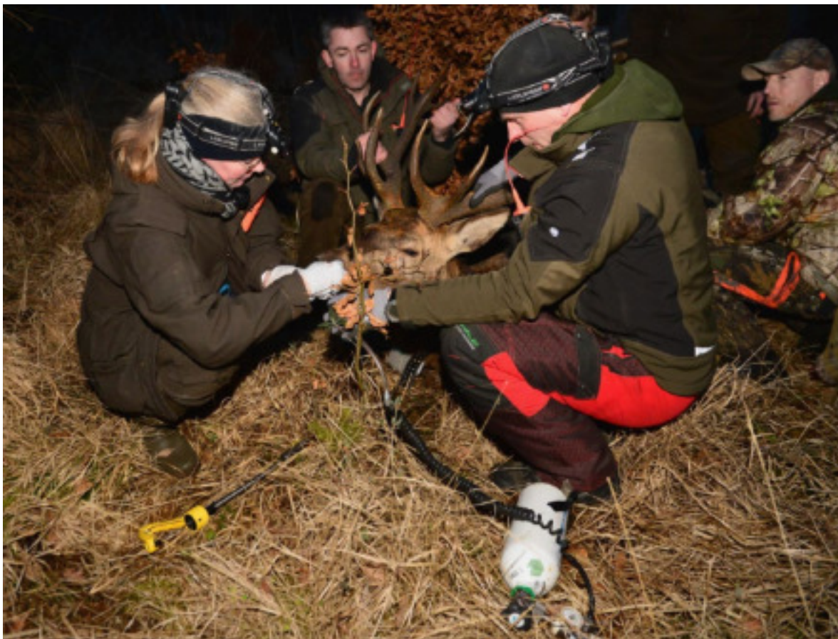
Figur 3: Eksempel på slide fra oplægget. Se eventuelt flere blandt bilagene.

For så vidt angår det vildtbiologiske er der heller ikke gjort endelige konklusioner endnu. Der er dog lavet foreløbige opgørelser af homeranges for 4 mærkede hinde, der sender data (en femte er mærket, men sender ikke for nuværende). Disse opgørelser viser ganske store homeranges med 95 % værdier rangerende mellem 990 og 2.500 ha og 50 % værdier på mellem 190 og 480 ha. Yderligere krondyr vil blive for søgt mærket i kommende efterår/vinter. På den vildtbiologiske side arbejdes der også med andre aspekter end mærkning. Der indsamles kæber fra nedlagte dyr for at kunne estimere alder ligesom en App til indsamling af afskydningsdata søges implementeret. Der foreligger endnu et stort analysearbejde i relation til det vildtbiologiske.